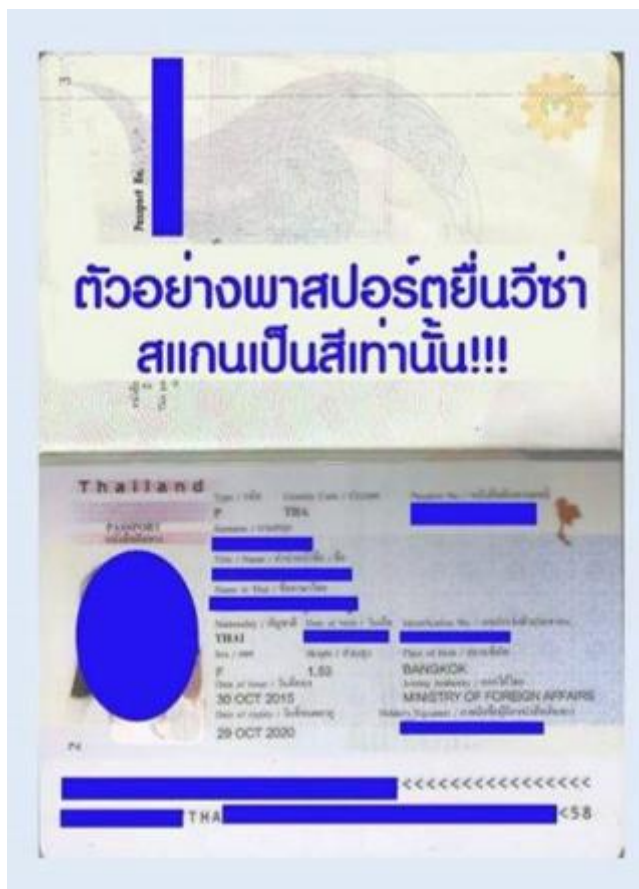
ตัวอย่าง