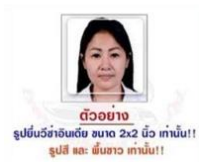
ตัวอย่าง