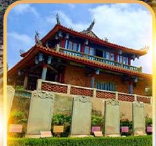
หอคอยจื่อคั่น