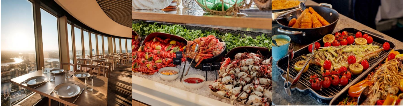
* รูปเพื่อการโฆษณาเท่านั้น *

นำท่านขึ้นหอคอยซิดนีย์ พร้อมรับประทานอาหาร บูฟเฟ่ต์นานาชาติ SKYFEAST AT SYDNEY TOWER RESTAURANT พร้อมชมวิวมุมสูงของนครซิดนีย์