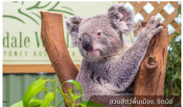
สวนสัตว์พื้นเมือง, ซิดนีย์