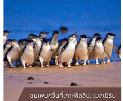
ชมเพนกวินที่เกาะฟิลลิป, เมลเบิร์น