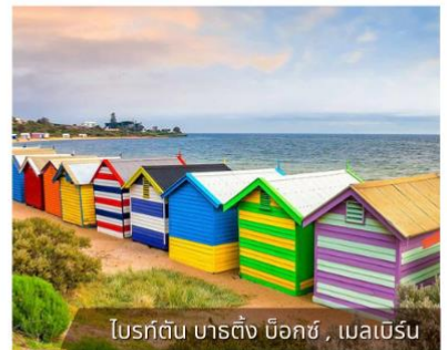
โบรท์ตัน บาร์ดิง น็อกซ์, เมลเบิร์น