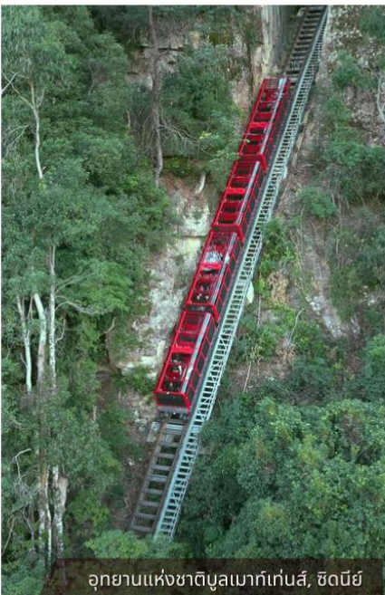
อุทยานแห่งชาติบูลเมาก์เท่นส์, ซิดนีย์