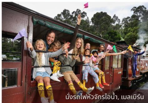
นั่งรถไฟหัวจักรไอน้ำ, เมลเบิร์น