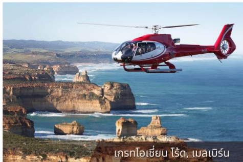
เฮลิคอปเตอร์, เมลเบิร์น