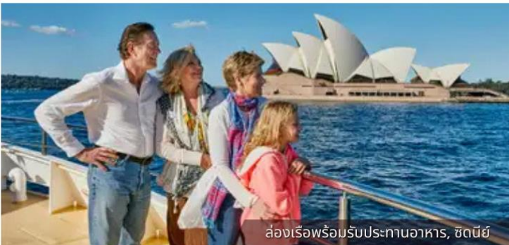
ล่องเรือพร้อมรับประทานอาหาร, ซิดนีย์