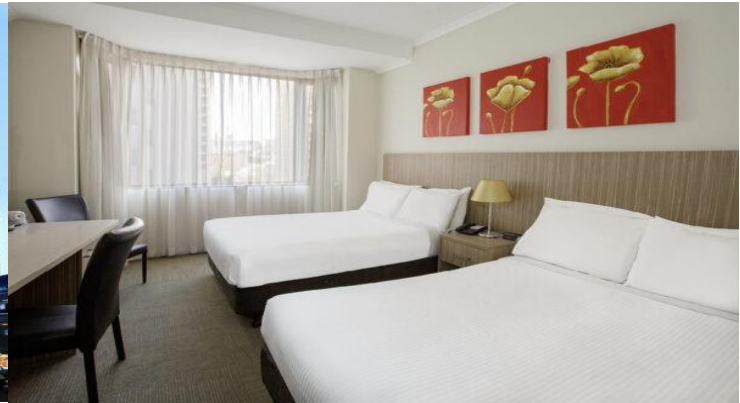
(โรงแรมย่านกลางเมือง ใกล้แหล่งช้อปปิ้ง เดินทางสะดวก) *รูปภาพเพื่อการโฆษณา*

วันที่ห้า ซิดนีย์ – อุทยานแห่งชาติบลูเมาท์เท็นส์ – เขาสามองศ์ – ช้อปปิ้งย่านใจกลางเมืองและห้าง Q.V.B.