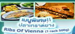
เมนูพิเศษ!! ปลาเกรดอย่าง Ribs Of Vienna (1 rack 500g)