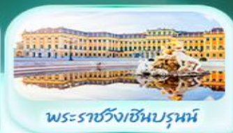
พระราชวังซินบรุนน์