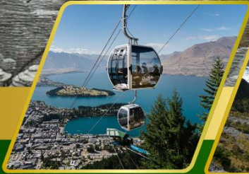
นั่งกระเช้าคอนโดล่า รับประทานอาหาร บนยอดเขาบ็อบพ็อค