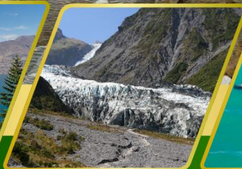
ธารน้ำแข็ง FOX GLACIER