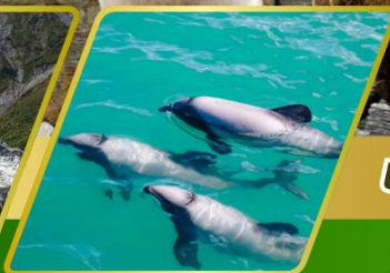
ล่องเรือชมโลมา อ่าวอาคารัว