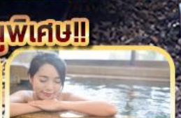
แช่น้ำแร่ร้อนตัว