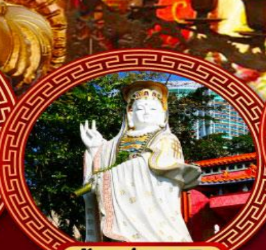
เจ้าแม่กวนอิม ริพัลส์เบย์