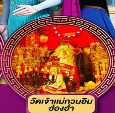
วัดเจ้าแม่กวนอิม ฮองฮ่า