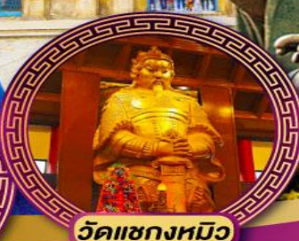
วัดเซกตมโฮว