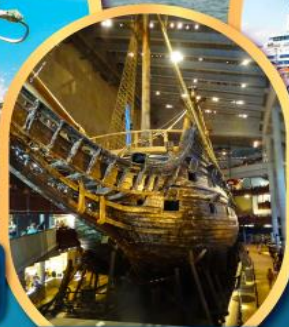
พิพิธภัณฑ์เรือทัวซา