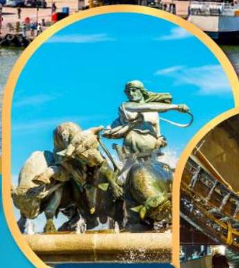
น้ำพุแห่งราชินีเกฟ็อน