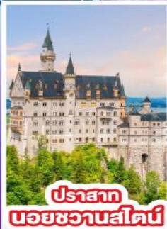
ปราสาท นอยชวานสไตน์