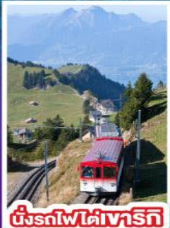
นั่งรถไฟใต้เขาวารีทิ