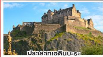
ปราสาทเอดินบะระ

เยือนสโตนเฮนจ์, และ พิพิธภัณฑ์โรมันโบราณ