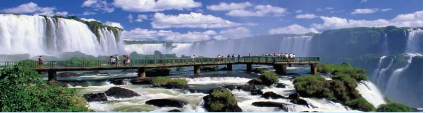
วันที่สี่ น้ำตกอิกวาสู (1 ใน 7 สิ่งมหัศจรรย์ของโลก) – ล่องเรือเจตามาคูโค – เชื่อนอิไตปู – ลิมา