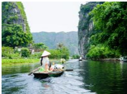
นิงห์บิงห์