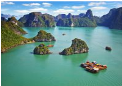
อ่าวฮาลองเบย์

วิหารวรรณกรรม – ซุปป์ิงตลาดกลางคืน – ล่องเรืออ่าวฮาลอง – ถ้ำนางฟ้า นิงห์บิงห์ – ล่องเรือฮาลองบก – ถ้ำดำถ้ำอก – ทะเลสาบคืนดาบ โซว์หุ่่นกระบอกน้ำ – สุสานลุงโฮ – วัดเจติยโสเสาเดียว – พิพิธภัณฑท์โฮจิมินห์ ทะเลสาบตะวันตก – ซุปป์ิงถนน 36 สาย